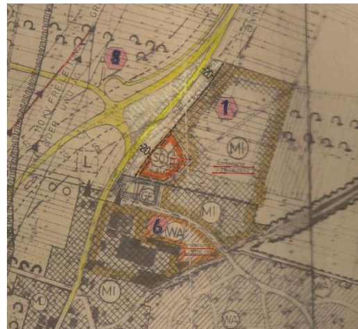
Änderungen 1992 und 1993

Die Flächen werden als Sondergebiet SO1 und Sondergebiet SO2 ausgewiesen.