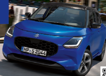
Abbildung zeigt aufpreispflichtige Sonderausstattung. Mehr Informationen zu Ausstattungslinie und Sonderausstattungen finden Sie hier: