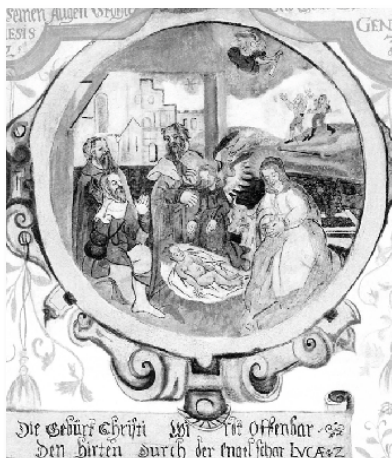
Medaillon Christi Geburt, Martinskapelle Bürgstadt