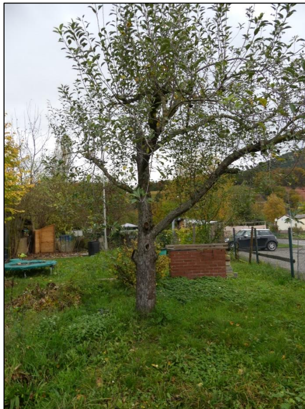
Abb. 8 Gartenbrache im zentralen westlichen Teil des Geltungsbereichs (06.11.2019)