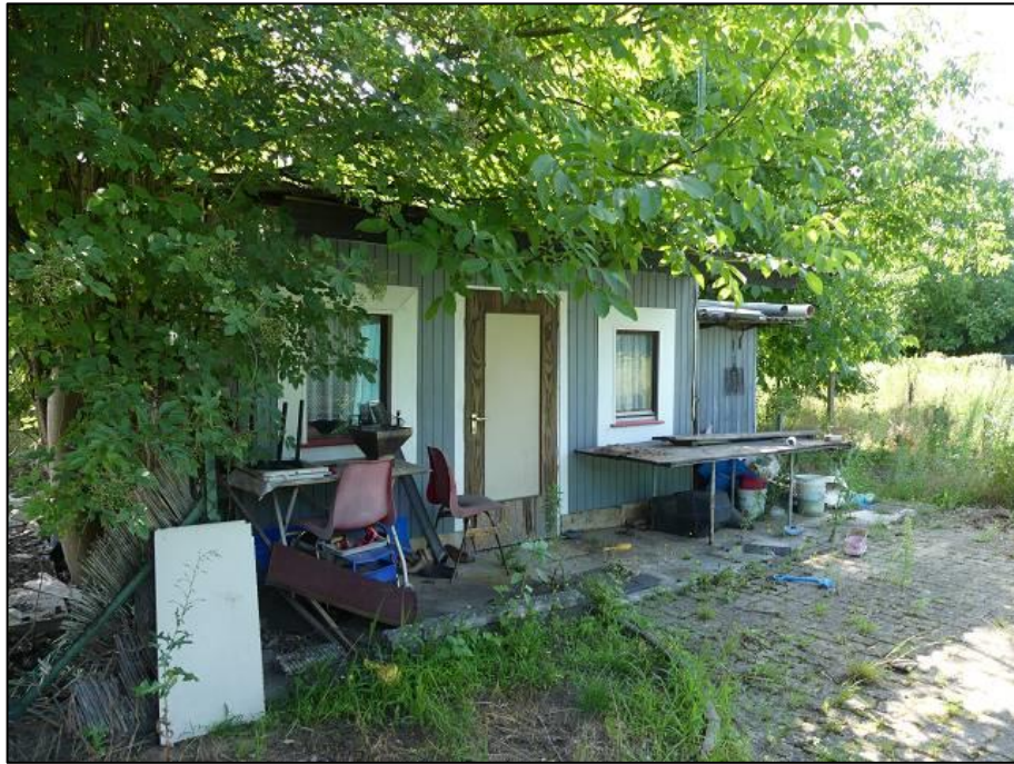
Abb. 11: Gartenhütte im südlichen Teil des Geltungsbereichs, potenzielle Quartierstandorte für Fledermäuse und potenzielle Niststandorte für Vögel (21.07.2020)